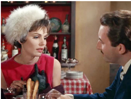
1964 DEUX COPINES, UN SÉDUCTEUR ('The World of Henry Orient) de G. Roy Hill avec Peter Sellers