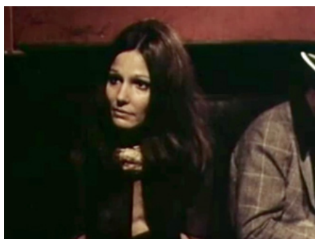
1971 NÉ POUR VAINCRE (Born to win) d'Ivan Passer