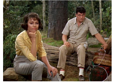
1964 LE SPORT FAVORI DE L'HOMME (Man's favorite Sport) d'Howard Hawks avec Rock Hudson