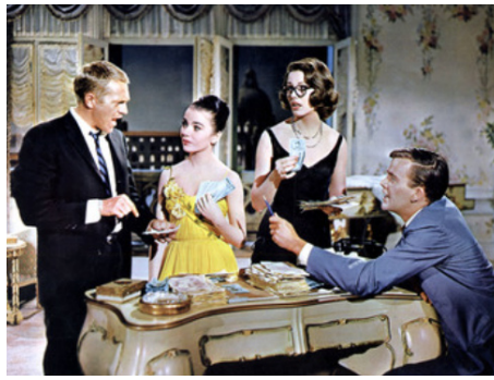
1961 BRANLE-BAS AU CASINO (The Honeymoon Machine) de R. Thorpe avec Steve McQueen, Brigid Bazlen, J. Hutton