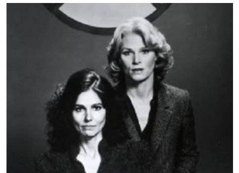
1983 LE COMBAT DE CANDY LIGHTNER (M.A.D.D.) de William A. Graham avec Mariette Hartley