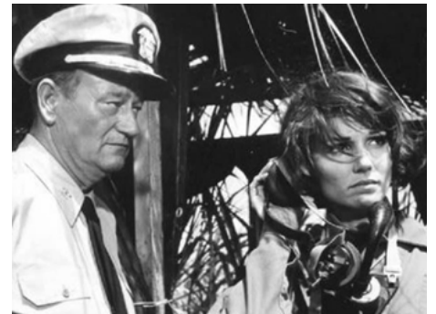
1965 PREMIÈRE VICTOIRE (In Harm's Way) d'Otto Preminger avec John Wayne