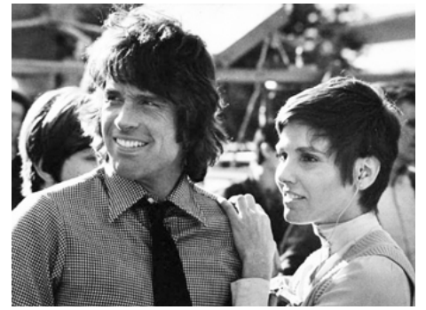
1974 À CAUSE D'UN ASSASSINAT (The Parallax View) d'Alan J. Pakula avec Warren Beatty