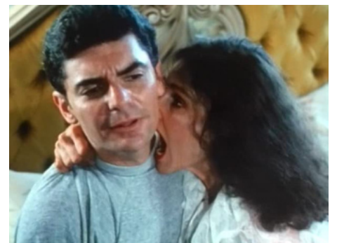
1981 SAMEDI 14 (Saturday the 14th) d'Howard R. Cohen avec Richard Benjamin