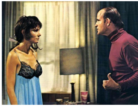
1974 JO LE FOU (Crazy Joe) de Carlo Lizzani avec Peter Boyle