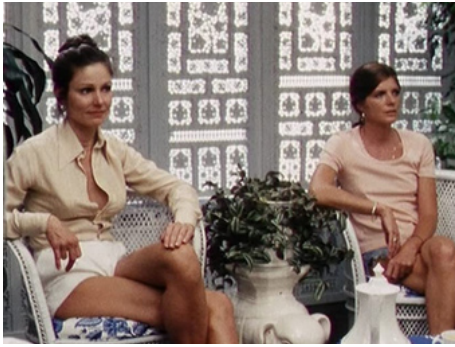
1975 LES FEMMES DE STEPFORD (The Stepford Wives) de Bryan Forbes avec Katharine Ross