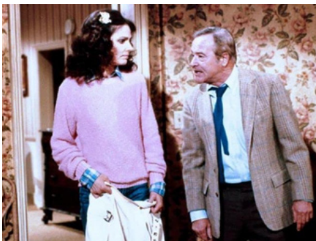
1981 VICTOR LA GAFFE (Buddy Buddy) de Billy Wilder avec Jack Lemmon