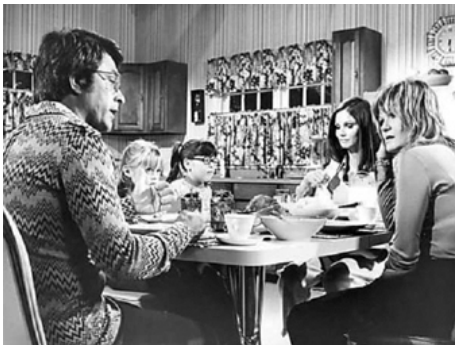
1972 THE COUPLE TAKES A WIFE de Jerry Paris avec Bill Bixby, Valerie Perrine