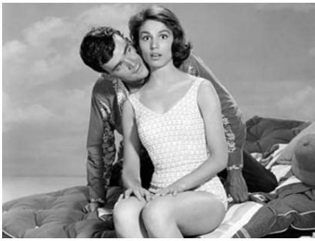
1960 CES FOLLES FILLES D'ÈVE (Where the Boys are) d'Henry Levin avec Jim Hutton