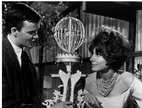
1964 AMOUR TOUJOURS (Looking for Love) de Don Weis avec Jim Hutton