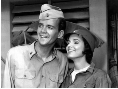
1962 LA GUERRE EN DENTELLES (The Horizontal Lieutenant) de Richard Thorpe avec Jim Hutton