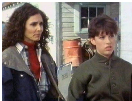
1983 PACKIN' IT IN de Judd Taylor avec Molly Ringwald