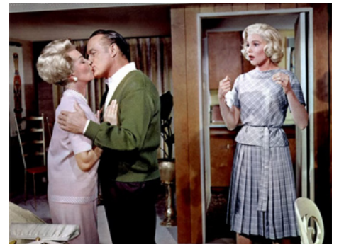
1961 L'AMÉRICAIN ET L'AMOUR (Bachelor in Paradise) de Jack Arnold avec Lana Turner, Bob Hope