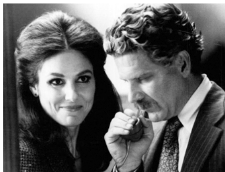
1980 FLICS-FRAC ! (The black Marble) d'Harold Becker avec Robert Foxworth