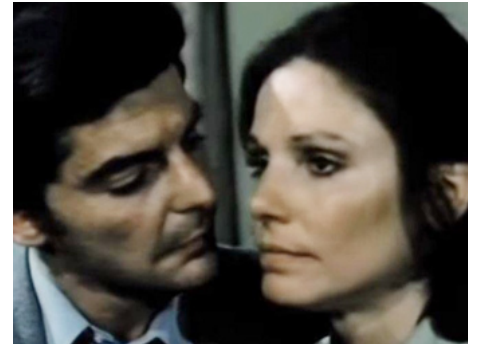
1978 SANS ISSUE (No Room to Run) de Robert Mitchell Lewis avec Richard Benjamin