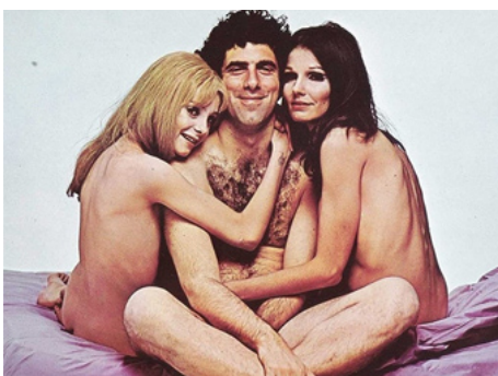
1970 MOVE (Move) de Stuart Rosenberg avec Genevieve Waite, Elliott Gould