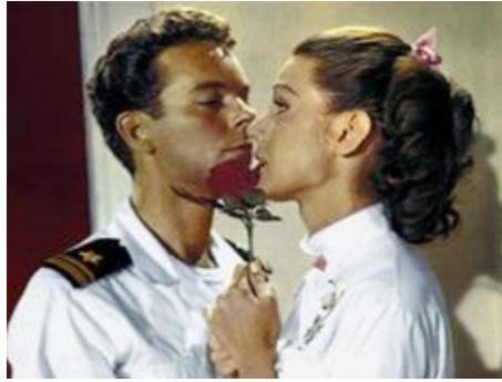
1963 EN SUIVANT MON CŒUR (Follow the Boys) de Richard Thorpe avec Russ Tamblyn