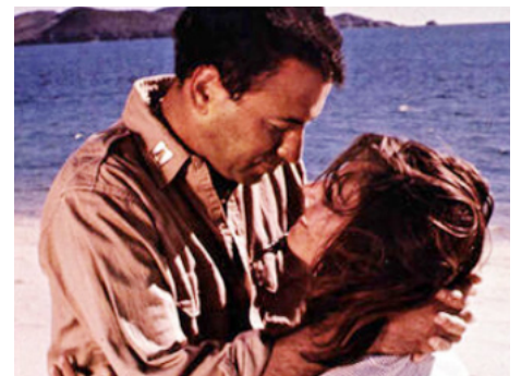
1970 CATCH 22 (Catch 22) de Mike Nichols avec Alan Arkin