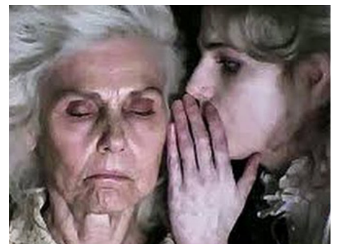
2016 I AM THE PRETTY THING THAT LIVES IN THE HOUSE d'Osgood Perkins avec Lucy Boynton