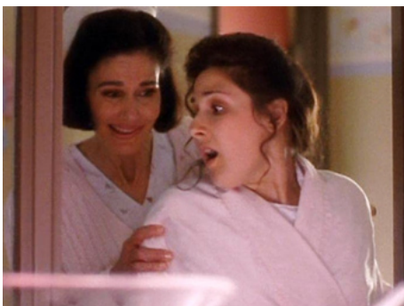
1996 MADAME WINTERBOURNE (Mrs Winterbourne) de Richard Benjamin avec Ricki Lane